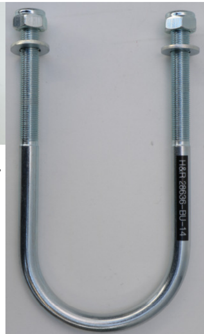
Abb. 1: Einbaurichtung Abstandskörper und Federbügel