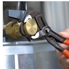
Schnelle und passgenaue Einstellung direkt am Werkstück