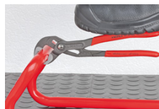
Gegen die Drehrichtung versetzte Zähne bewirken einen Selbstklemmeffekt und verhindern das Abrutschen am Werkstück.