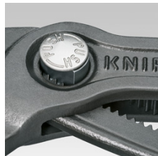
Feinverstellung per Druckknopf: schnell und komfortabel