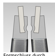
Formschluss durch Verpressung

Technische Änderungen und Irrtümer vorbehalten