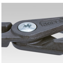
Geschraubtes Gelenk: hohe Präzision und optimale Gängigkeit