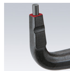
Stabile, eingesetzte Spitzen aus hochverdichtetem Federstahl