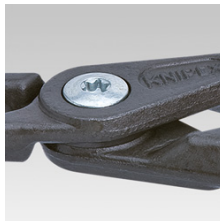
Geschraubtes Gelenk: hohe Präzision und optimale Gängigkeit