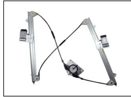
Nostro alzacristallo – our window regulator – notre lève-vitre – unser Fensterheber – nuestro elevalunas – nosso levantador de vidro - bizim cam acacagi - Γρύλος δικός μας