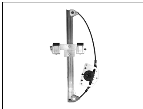
Nostro alzacristallo – our window regulator – notre lève-vitre – unser Fensterheber – nuestro elevallunas – nosso levantador de vidro - bizim cam acacagi - Γρύλος δικός μας