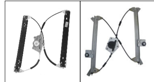
Alzacristallo originale – oem window regulator – lève-vitre original – Fensterheber von oem – elevalunas original – levandator de vidro original orijinal cam acacagi - Γρύλος γνήσιος