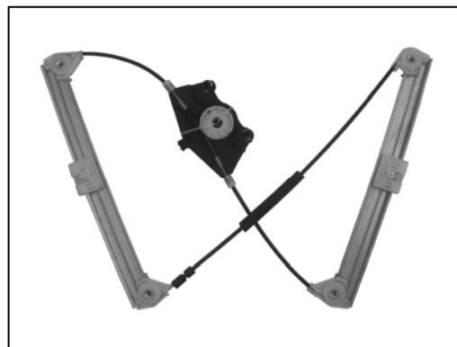
Nostro alzacristallo – our window regulator – notre lève-vitre – unser Fensterheber – nuestro elevavinas – nosso levantador de vidro - bizim cam acacagi - Γρύλος δικός μας