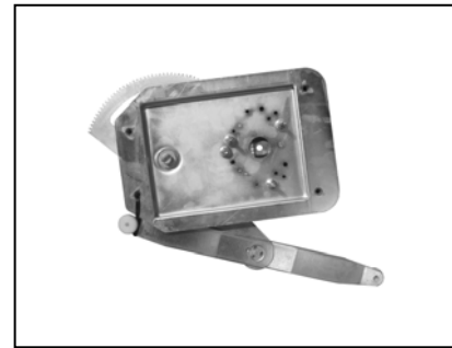
Nostro alzacristallo – our window regulator – notre lève-vitre – unser Fensterheber – nuestro elevalunas – nosso levantador de vidro - bizim cam acacagi - Γρύλος δικός μας