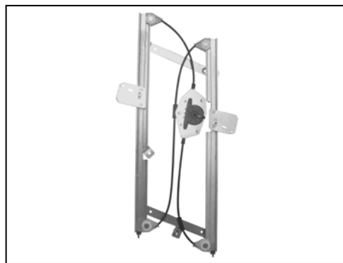
Nostro alzacristallo – our window regulator – notre lève-vitre – unser Fensterheber – nuestro elevallunas – nosso levantador de vidro - bizim cam acacagi - Γρύλος δικός μας