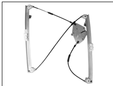
Nostro alzacrystallo - our window regulator - notre lève-vitre - unser Fensterheber - nuestro elevallunas - nosso levantador de vidro - bizim cam acacagi - Γρύλος δικός μας