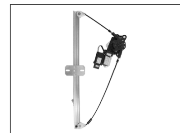
Il nostro alzacristallo - our window regulator - notre lève-vitre - unser Fensterheber - nuestro elevador de vidrio - bizim cam acacagi - Γρύλος δικός μας