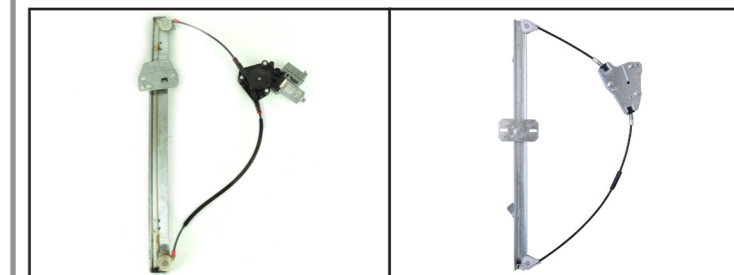
Alzacristallo originale - oem window regulator - lève-vitre original - Fensterheber von oem - elevalunas original - levantator de vidro original - orijinal cam acacagi - Γρύλος γήσιος Nostro alzacristallo - our window regulator - notre lève-vitre - unser Fensterheber - nuestro elevalunas-nosso levantator de vidro - bizim cam acacagi - Γρύλος γήσιος