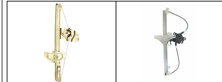
Alzacristallo originale - oem window regulator - lève-vitre original - Fensterheber von oem - elevallunas original - levantador de vidro original - orijinal cam acacagi - Γρύλος γνήσιος