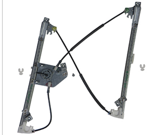
POWER WINDOW RIGHT ALZACRISTALLI ELETTRICO DX

THIS INSTALLATION INSTRUCTION IS FOR BOTH LEFT AND RIGHT SIDE. CETTE INSTRUCTION DE MONTAGE EST POUR LES DEUX COTES DROIT ET GAUCHE. DIESE MONTAGE-ANLEITUNG IST FÜR DIE BEIDE LINKE UND RECHTE SEITE. ESTA INSTRUCCION DE MONTAJE ES PARA LOS DOS LADOS IZQUIERDO Y DERECHO. ESTAS INSTRUÇÕES VALEM TANTO PARA O LADO ESQUERDO QUANTO PARA O DIREITO. LA PRESENTE ISTRUZIONE VALE SIA PER IL LATO SINISTRO CHE PER IL LATO DESTRO.