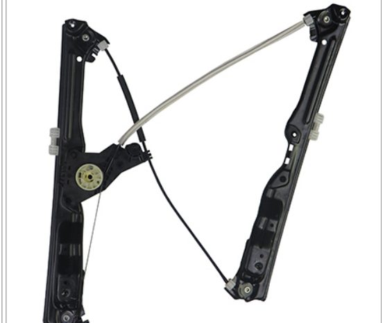
ORIGINAL POWER WINDOW RIGHT ALZACRISTALLI ELETTRICO ORIGINALE DX