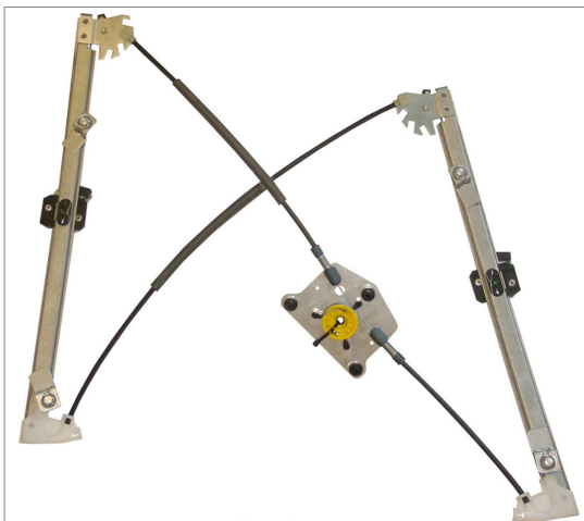
A POWER WINDOW LEFT ALZACRISTALLI ELETTRICO SX

THIS INSTALLATION INSTRUCTION IS FOR BOTH LEFT AND RIGHT SIDE. CETTE INSTRUCTION DE MONTAGE EST POUR LES DEUX COTES DROIT ET GAUCHE. DIESE MONTAGE-ANLEITUNG IST FÜR DIE BEIDE LINKE UND RECHTE SEITE. ESTA INSTRUCCION DE MONTAJE ES PARA LOS DOS LADOS IZQUIERDO Y DERECHO. ESTAS INSTRUÇÕES VALEM TANTO PARA O LADO ESQUERDO QUANTO PARA O DIREITO. LA PRESENTE ISTRUZIONE VALE SIA PER IL LATO SINISTRO CHE PER IL LATO DESTRO.