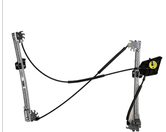
A POWER WINDOW LEFT ALZACRISTALLI ELETTRICO SX

THIS INSTALLATION INSTRUCTION IS FOR BOTH LEFT AND RIGHT SIDE. CETTE INSTRUCTION DE MONTAGE EST POUR LES DEUX COTES DROIT ET GAUCHE. DIESE MONTAGE-ANLEITUNG IST FÜR DIE BEIDE LINKE UND RECHTE SEITE. ESTA INSTRUCCION DE MONTAJE ES PARA LOS DOS LADOS IZQUIERDO Y DERECHO. ESTAS INSTRUÇÕES VALEM TANTO PARA O LADO ESQUERDO QUANTO PARA O DIREITO. LA PRESENTE ISTRUZIONE VALE SIA PER IL LATO SINISTRO CHE PER IL LATO DESTRO.