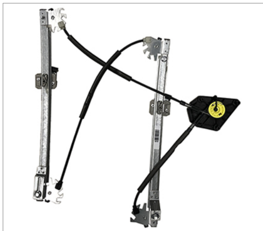
A POWER WINDOW LEFT ALZACRISTALLI ELETTRICO SX

THIS INSTALLATION INSTRUCTION IS FOR BOTH LEFT AND RIGHT SIDE. CETTE INSTRUCTION DE MONTAGE EST POUR LES DEUX COTES DROIT ET GAUCHE. DIESE MONTAGE-ANLEITUNG IST FÜR DIE BEIDE LINKE UND RECHTE SEITE. ESTA INSTRUCCION DE MONTAJE ES PARA LOS DOS LADOS IZQUIERDO Y DERECHO. ESTAS INSTRUÇÕES VALEM TANTO PARA O LADO ESQUERDO QUANTO PARA O DIREITO. LA PRESENTE ISTRUZIONE VALE SIA PER IL LATO SINISTRO CHE PER IL LATO DESTRO.