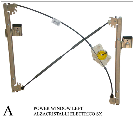
A POWER WINDOW LEFT ALZACRISTALLI ELETTRICO SX

THIS INSTALLATION INSTRUCTION IS FOR BOTH LEFT AND RIGHT SIDE. CETTE INSTRUCTION DE MONTAGE EST POUR LES DEUX COTES DROIT ET GAUCHE. DIESE MONTAGE-ANLEITUNG IST FÜR DIE BEIDE LINKE UND RECHTE SEITE. ESTA INSTRUCCION DE MONTAJE ES PARA LOS DOS LADOS IZQUIERDO Y DERECHO. ESTAS INSTRUÇÕES VALEM TANTO PARA O LADO ESQUERDO QUANTO PARA O DIREITO. LA PRESENTE ISTRUZIONE VALE SIA PER IL LATO SINISTRO CHE PER IL LATO DESTRO.