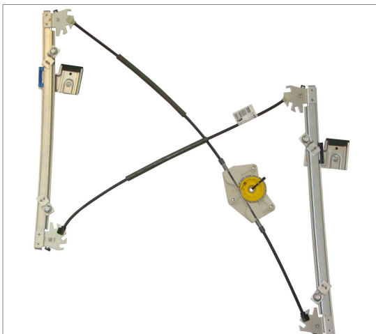
A POWER WINDOW LEFT ALZACRISTALLI ELETTRICO SX

THIS INSTALLATION INSTRUCTION IS FOR BOTH LEFT AND RIGHT SIDE. CETTE INSTRUCTION DE MONTAGE EST POUR LES DEUX COTES DROIT ET GAUCHE. DIESE MONTAGE-ANLEITUNG IST FÜR DIE BEIDE LINKE UND RECHTE SEITE. ESTA INSTRUCCION DE MONTAJE ES PARA LOS DOS LADOS IZQUIERDO Y DERECHO. ESTAS INSTRUÇÕES VALEM TANTO PARA O LADO ESQUERDO QUANTO PARA O DIREITO. LA PRESENTE ISTRUZIONE VALE SIA PER IL LATO SINISTRO CHE PER IL LATO DESTRO.