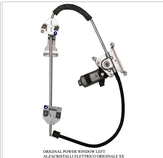
ORIGINAL POWER WINDOW LEFT ALZACRISTALLI ELETTRICO ORIGINALE SX