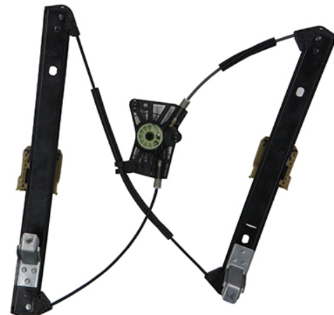
ORIGINAL POWER WINDOW RIGHT ALZACRISTALLI ELETTRICO ORIGINALE DX