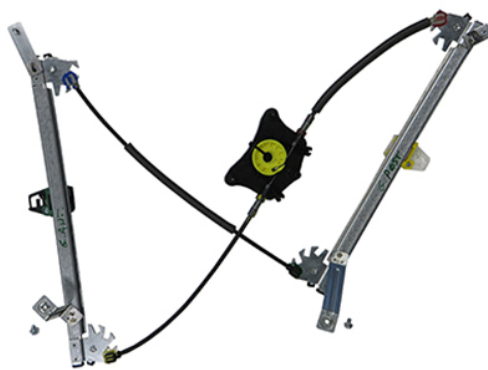
POWER WINDOW RIGHT ALZACRISTALLI ELETTRICO DX

THIS INSTALLATION INSTRUCTION IS FOR BOTH LEFT AND RIGHT SIDE. CETTE INSTRUCTION DE MONTAGE EST POUR LES DEUX COTES DROIT ET GAUCHE. DIESE MONTAGE-ANLEITUNG IST FÜR DIE BEIDE LINKE UND RECHTE SEITE. ESTA INSTRUCCION DE MONTAJE ES PARA LOS DOS LADOS IZQUIERDO Y DERECHO. ESTAS INSTRUÇÕES VALEM TANTO PARA O LADO ESQUERDO QUANTO PARA O DIREITO. DEZE AANWIJZINGEN GELDEN VOOR ZOWEL DE LINKER- ALS DE RECHTERKANT. Η ΠΑΡΟΥΣΑ ΟΔΗΓΙΑ ΑΦΟΡΑ ΤΟΣΟ ΤΗΝ ΑΡΙΣΤΕΡΗ ΟΣΟ ΚΑΙ ΤΗ ΔΕΞΙΑ ΠΛΕΥΡΑ. LA PRESENTE ISTRUZIONE VALE SIA PER IL LATO SINISTRO CHE PER IL LATO DESTRO.