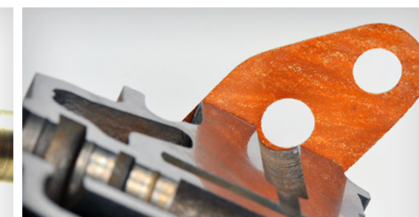
Forme et positionnement des joints inappropriés