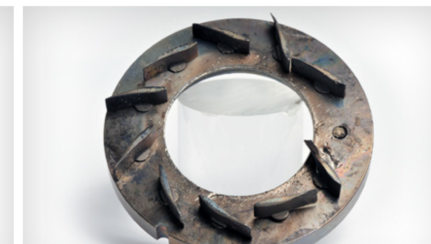
Panne de la géométrie variable