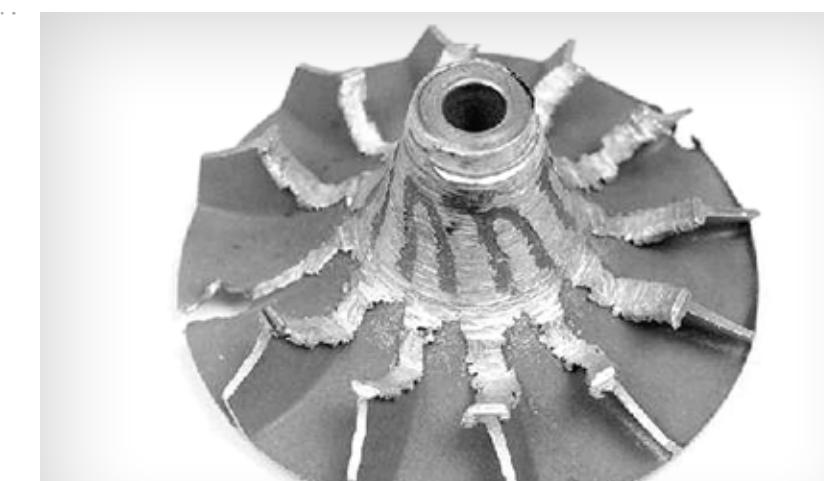
Panne d'une roue compresseur

Avarie de la roue du turbo et/ou des ailettes variables provoquée par l'entrée de petits objets dans la turbine ou le carter de compresseur à une vitesse élevée, ce qui limite le mouvement des ailettes et entraîne un déséquilibre de la roue.