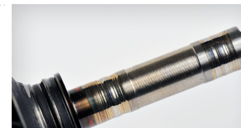
Système de roulement usé et rayé. Transfert de matériaux vers l'arbre

Avarie du système de l'ensemble tournant du turbo généralement provoquée par une concentration élevée de calamine en suspension dans l'huile du fait d'intervalles trop importants entre chaque vidange d'huile et changement de filtre ou d'une maintenance insuffisante. Les roulements peuvent également être endommagés par des particules métalliques résultant de l'usure du moteur ou par la présence de grenailles d'acier en suspension dans l'huile après une révision complète du moteur.