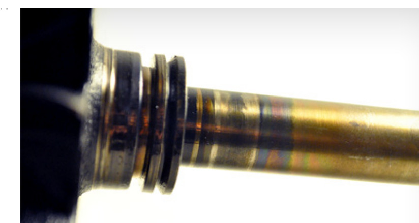
Température élevée et transfert de matériaux vers le système de roulement

Fissures par fatigue du turbo et transfert de matériaux résultant de frottements métalliques et de températures élevées provoqués par une restriction du système d'admission d'huile, un mauvais positionnement des joints et l'utilisation de joints liquides ou de lubrifiants de mauvaise qualité.