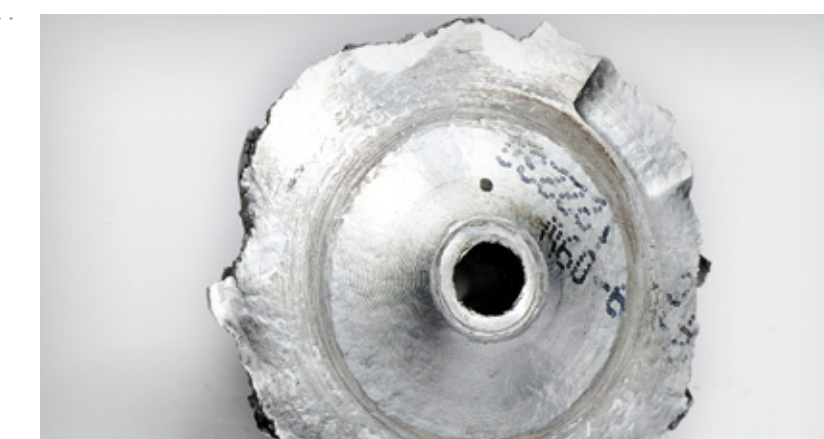
Effet peau d'orange sur la face arrière du compresseur indiquant clairement une vitesse excessive

Avarie du turbo provoquée par un fonctionnement au-delà des paramètres de service ou hors des spécifications du constructeur automobile. Les problèmes de maintenance, dysfonctionnements du moteur ou améliorations non autorisées des performances peuvent se traduire par une augmentation de la vitesse de rotation du turbo au-delà de ses limites de fonctionnement, provoquant du même coup une rupture par fatigue du compresseur et de la roue de turbine.