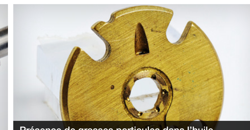
Présence de grosses particules dans l'huile susceptibles de provoquer de profondes rayures et un impact important