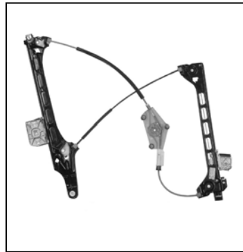
Elevalunas original Oem window regulator