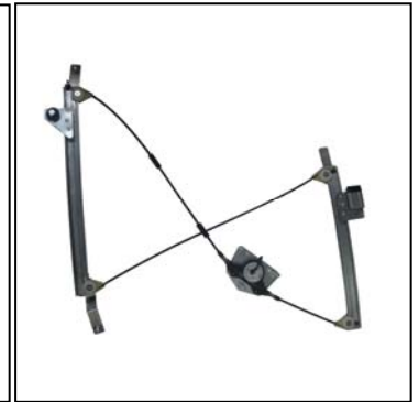
Nuestro elevallas Our window regulator