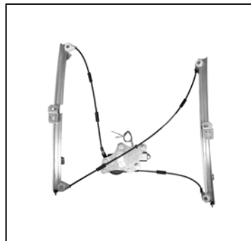
Nuestro elevavinas Our window regulator