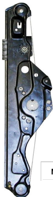
Meccanismo originale SX

SOLO MECCANISMO MECHANISM ONLY MECANISME (PAS DE MOTEUR)