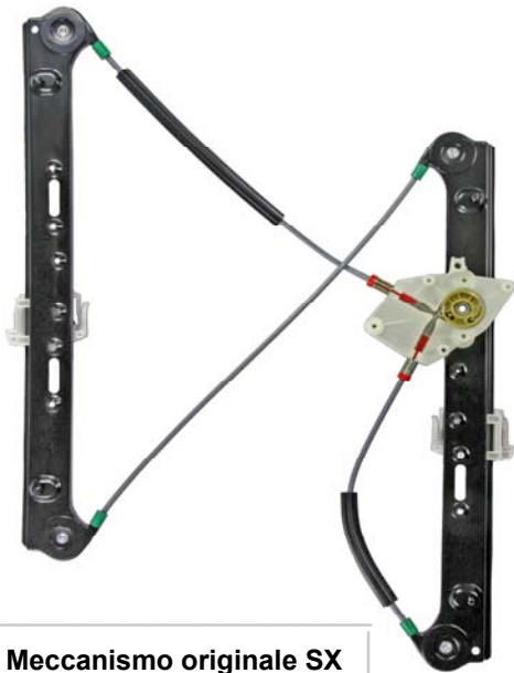
Meccanismo originale SX

SOLO MECCANISMO MECHANISM ONLY MECANISME (PAS DE MOTEUR)