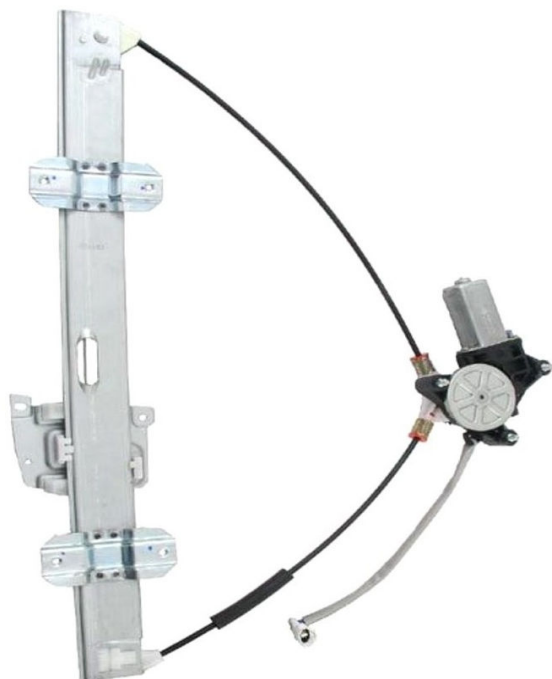
Alzacristallo originale SX