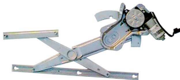
ORIGINAL POWER WINDOW LEFT ALZACRISTALLI ELETTRICO ORIGINALE SX