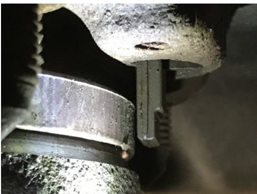
Abb. 2 Bremsscheibe und Sensor korrekt montiert

Bei der Montage dieser Bremsscheibe am Achsschenkel ist jedoch Vorsicht geboten, da diese Bremsscheiben-/Radlager-Einheit auch mit einem mehrpoligen Impulsring für den Raddrehzahlsensor ausgestattet ist.