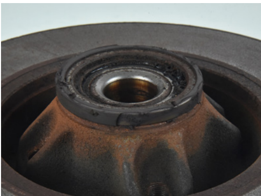
Abb. 1 Durch Kontakt mit dem Sensor beschädigter Impulsring

Viele Peugeot-, Citroën- und DS-Modelle sind an der Hinterachse mit Bremsscheiben ausgestattet, die ein integriertes Radlager haben. Diese Art des Aufbaus ermöglicht eine erhebliche Gewichtseinsparung, da die Bremsscheibe gleichzeitig die Radnabe ist. Dieses vormontierte Teil macht zudem den Austausch für die Werkstatt schneller und einfacher und verhindert das Risiko, ein Radlager mit falschem Spiel oder falsch positioniertem Dichtring zu montieren.