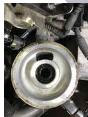
Válvula instalada corretamente

Antes de instalar o novo filtro de óleo, assegure-se de que a válvula está instalada no suporte. Se a válvula estiver em falta (tendo 'saltado' conforme explicado anteriormente), encontre e limpe a válvula original, lubrifique os vedantes 'o'-ring e insira-os novamente no suporte. Em alternativa, pode instalar uma nova válvula - antes de instalar o novo filtro de óleo. (Referência nº 06J 115 679 E).