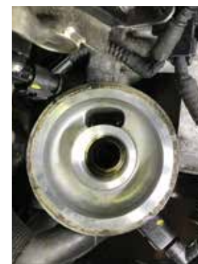
Válvula em falta

Para mais informação, visite: partsfinder.bilsteingroup.com