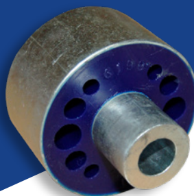
Polyurethaan bus - ADT380145

Toyota Hiace, Granvia, Grand Hiace (grijze import) alle modellen 1995>