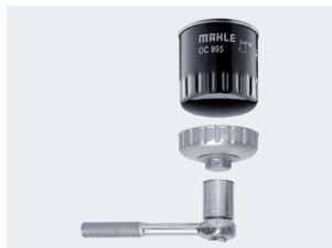
Εικόνα 1: Το εργαλείο απασφάλισης OCS επιτρέπεται να χρησιμοποιείται μόνο για λασκάρισμα.

Με τα φίλτρα OX, το κάλυμμα του περιβλήματος του φίλτρου λαδιού λασκάρει με ένα εργαλείο, π.χ. ένα σωληνωτό κλειδί, και σφίγγεται ξανά μετά την αντικατάσταση του φίλτρου με αυτό. Στα βιδωτά φίλτρα τα πράγματα είναι διαφορετικά. Το προς αλλαγή φίλτρο λασκάρει με ένα ειδικό εργαλείο απασφάλισης, π.χ. το