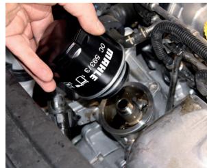
Figure 2: The new filter is tightened by hand.