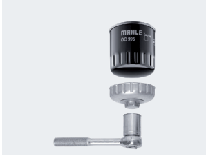
Resim 1: OCS sökme aleti, sadece sökme işlemi için kullanılabilir.