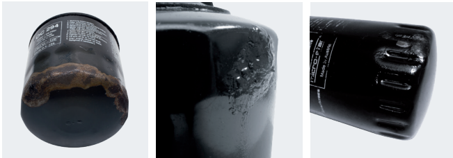
Resim 3: Vidalı filtrede korozyon hasarları oluşabilir.