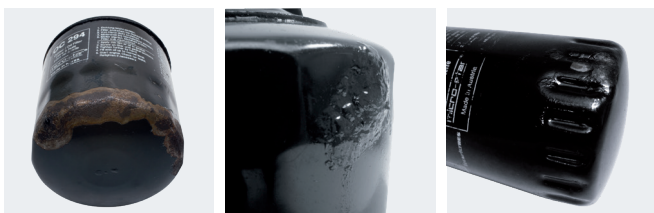
Abbildung 3: Am Anschraubfilter können Korrosionsschäden entstehen.

Bei Anschraubfiltern ist das anders. Gelöst wird der zu wechselnde Filter mit einem speziellen Lösewerkzeug, z. B. MAHLE OCS. Dieses Werkzeug darf jedoch nicht zur Montage des neuen Filters verwendet werden.