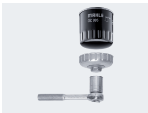
Abbildung 1: Das OCS-Lösewerkzeug darf nur zum Lösen benutzt werden.

Bei OX-Filtern wird der Deckel des Ölfiltergehäuses mit einem Werkzeug, z. B. einem Steckschlüssel, gelöst und nach dem Austausch des Filtereinsatzes mit diesem auch wieder festgezogen.