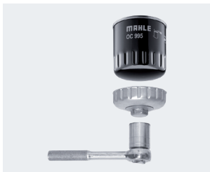
Figure 1: The OCS removal tool may only be used to loosen the filter.

In the case of OX filters, the cover of the oil filter housing is loosened with a tool, such as a socket spanner, and then