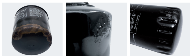
Zdjęcie 3: Wkręcany filtr oleju może ulec uszkodzeniu w wyniku korozji.

W przypadku wkręcanych filtrów oleju sprawa wygląda nieco inaczej. Wymieniany filtr odkręca się za pomocą specjalnego klucza do filtrów oleju, np. MAHLE OCS. Narzędzia tego nie wolno jednak używać do montażu nowego filtra. Filtry OC wolno dokręcać wyłącznie ręcznie i zgodnie z wytycznymi producenta pojazdu.