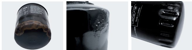
Иллюстрация 3: На навинчиваемом фильтре могут возникнуть повреждения от коррозии.

MAHLE OCS. Но для монтажа нового фильтра этот инструмент использовать нельзя. Фильтры ОС разрешается вкручивать только вручную, следуя указаниям автопроизводителя.