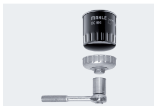
Zdjęcie 1: Klucza do filtrów oleju OCS wolno używać wyłącznie do odkręcania.

W przypadku filtrów OX pokrywę obudowy filtra oleju odkręca się za pomocą narzędzia, np. klucza nasadowego, a po wymianie wkładu filtra ponownie dokręca tym samym narzędziem.