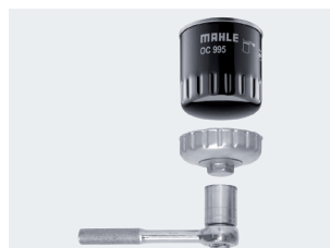
Figure 1 : L'outil de démontage OCS ne doit être utilisé que pour le desserrage.

Pour les filtres OX, le couvercle du boîtier du filtre à huile se desserre à l'aide d'un outil, par exemple une clé à douille, et se resserre à l'aide du même outil après remplacement de la cartouche filtrante. La procédure est différente pour les filtres à visser. On desserre