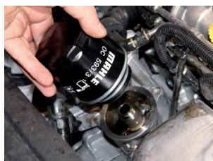
Figure 2 : Le nouveau filtre est serré à la main.