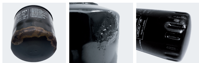
Figure 3 : Le filtre à visser peut être endommagé par la corrosion.

le filtre à remplacer à l'aide d'un outil de démontage spécial, par exemple l'OCS de MAHLE. Toutefois, il ne faut pas utiliser cet outil pour monter le nouveau filtre. Les filtres OC doivent être serrés exclusivement à la main et conformément aux instructions du constructeur automobile.