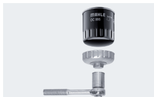
Иллюстрация 1: Демонтажный инструмент OCS разрешается использовать только для откручивания фильтра.

В фильтрах ОХ крышка корпуса откручивается с помощью инструмента, например, торцевого ключа, а после смены картриджа им же и затягивается. Монтаж навинчиваемых фильтров выполняется иначе. Заменяемый фильтр откручивается специальным демонтажным ключом, например