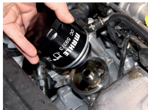
Εικόνα 2: Το νέο φίλτρο σφίγγεται με το χέρι.