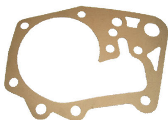
Joint en papier

L'étanchéité de la pompe se fait avec un :