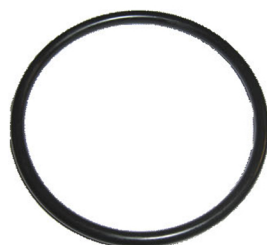
Joint torique rond

La lèvre du joint torique étant étanche, aucune pâte à joint supplémentaire ne doit être utilisée! Afin de maintenir le joint torique en position, un lubrifiant sans acide approprié peut être utilisé.