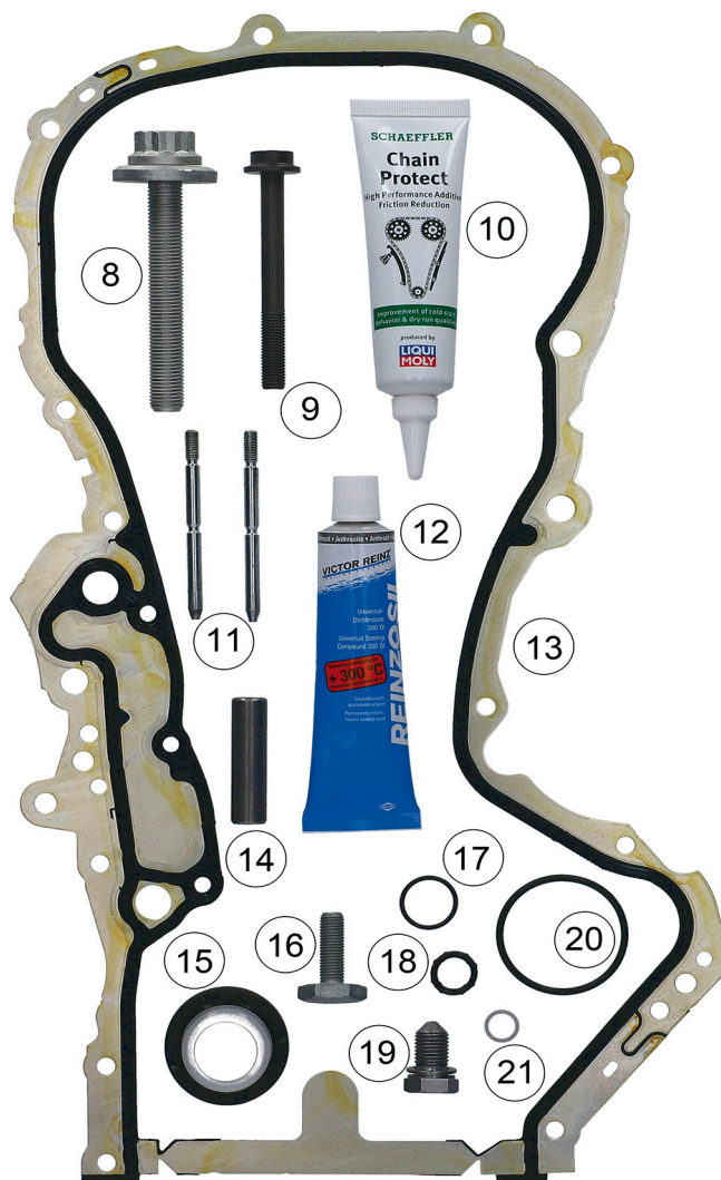
Figura 2: 559 0154 30/559 0154 31 - Accesorii KIT lanț distribuție

Știfturile de ghidare sunt incluse în ambele KIT-uri lanț de distribuție, ca elemente ajutătoare pentru montarea carcasei sistemului de distribuție și a băii de ulei. Înșurubați-le în chiușul, respectiv în blocul cilindrilor.