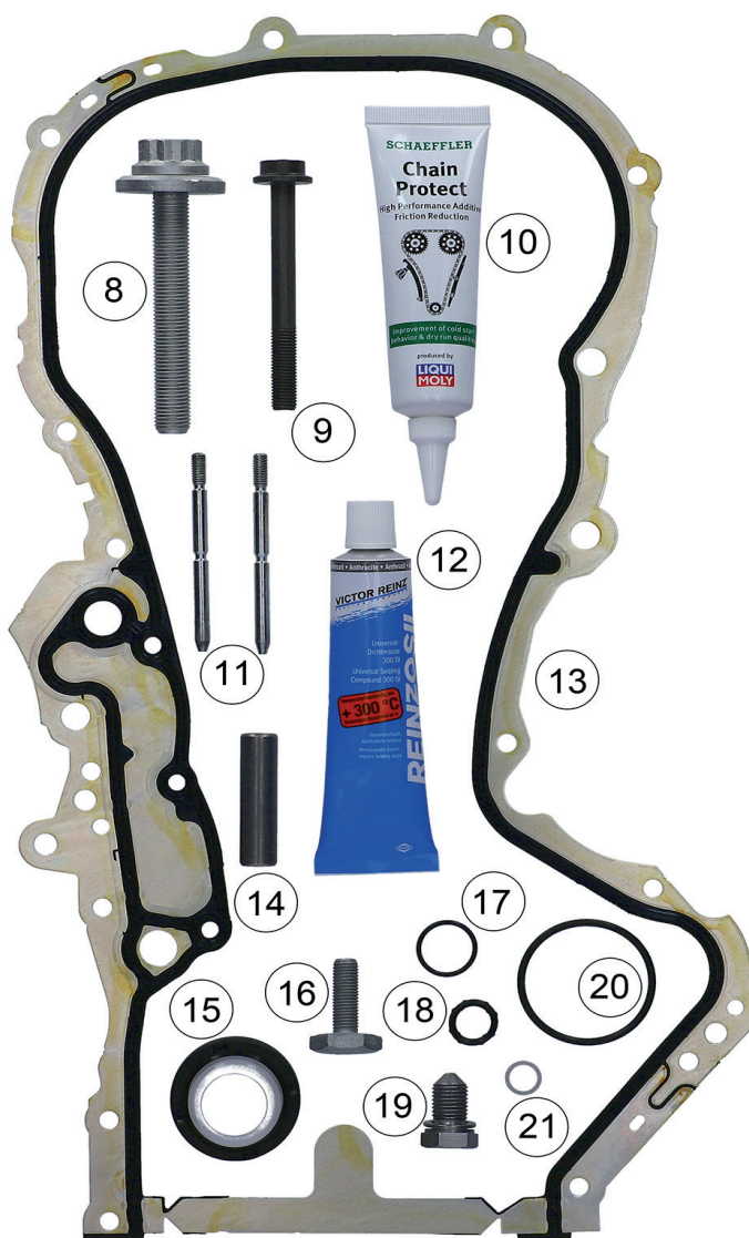
Photo 2 : 559 0154 30/559 0154 31 - Pièces jointes du kit de distribution par chaîne

Pour faciliter le montage, les deux kits de distribution par chaîne contiennent des tiges de guidage pour monter le boîtier de commande et le carter d'huile. Ces tiges se vissent dans la culasse ou le bloc-cylindres.