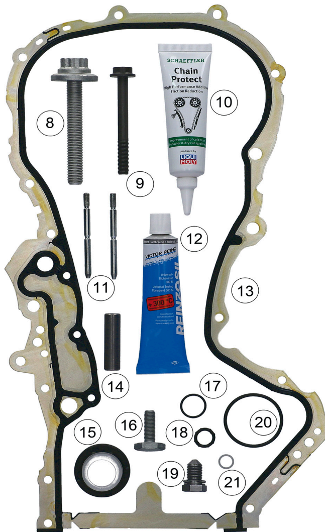
Εικόνα 2: 559 0154 30/559 0154 31 – Περιεχόμενα ΚΙΤ καδένας

Σαν βοήθημα κατά τοποθέτηση του καθρέφτη και του κάρτερ, παρέχονται μπουζόνια – οδηγοί και στα δύο ΚΙΤ καδένας Βιδώστε τα στην κυλινδροκεφαλή και τον κορμό, στις αντίστοιχες θέσεις.