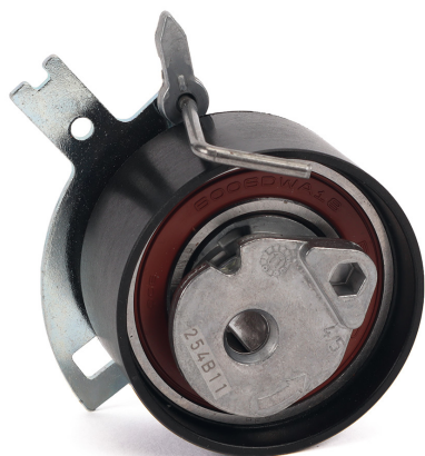
Bild 1: Spännrulle 531 0810 10

För aktuell användning, se reservdelskatalogen