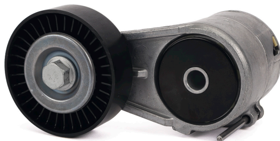
Figura 1: Exemplu de versiune veche, cu știft de montare

Ambele versiuni îndeplinesc specificațiile tehnice și pot fi utilizate fără restricții. În perioada de tranziție stocurile de produse pot să conțină ambele variante.