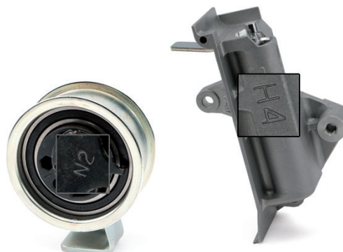
Photo 2: Galet tendeur réf. 531 0436 20 avec amortisseur de vibrations réf. 533 0035 10