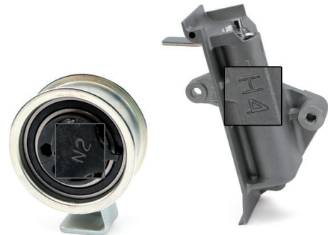
Fig. 2: Polea tensora 531 0436 20 con amortiguador de vibraciones 533 0035 10