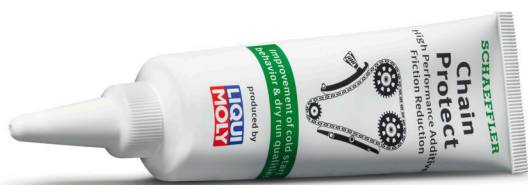
Figura 1: Schaeffler Chain Protect a fost conceput special pentru a fi utilizat la montarea noilor lanțuri de distribuție. Aditivul este disponibil exclusiv în KIT-ul cu lanț de distribuție INA.

În timpul reparației, trebuie folosit întregul conținut al tubului. Aditivul trebuie aplicat pe toate componentele – aceasta înseamnă lanțul de distribuție și toate roțile de lanț, precum și pe elementele de ghidare. Acesta se amestecă cu uleiul de motor și rămâne în motor până la următorul schimb de ulei.