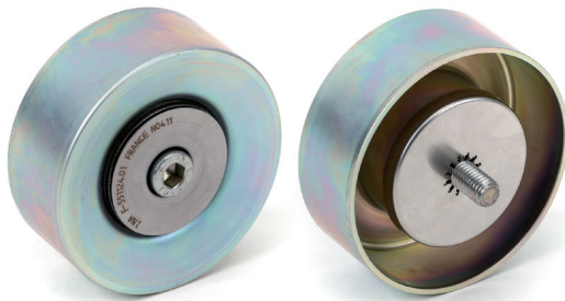
Figura 1: Rulli di rinvio con guarnizioni di vecchia generazione

Per i veicoli indicati, Schaeffler Automotive Aftermarket offre un rullo di rinvio con guarnizioni di nuova generazione (figura 2).