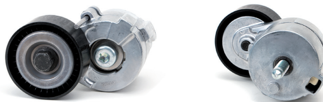
Figura 2: nuova versione

In base al continuo sviluppo dei nostri prodotti il braccio tenditore del gruppo secondario è stato ottimizzato per i codici motore sopra elencati. Pertanto, il precedente braccio tenditore 534 0241 10 viene sostituito con il numero articolo 534 0610 10.