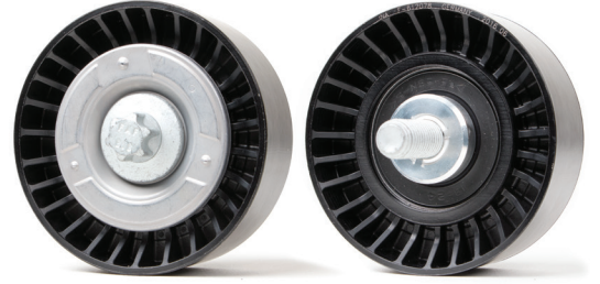
Resim 2: Yeni tasarım

Her ikisi de teknik özelliklere uygundur ve kısıtlama olmaksızın kullanılabilir.