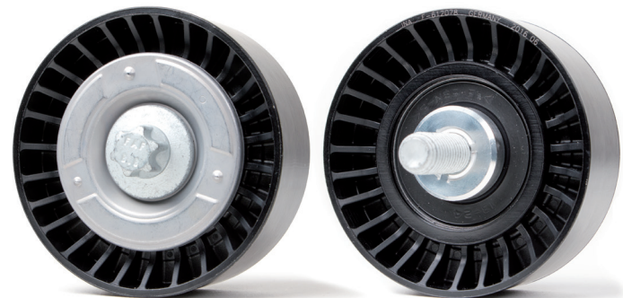
Figura 2: versión nueva

¡Observar las indicaciones del fabricante del vehículo!