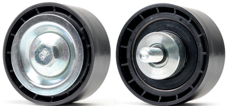
Figura 1: Versione precedente

Le due versioni si differenziano esclusivamente per l'aspetto esteriore, entrambe sono tecnicamente equivalenti e possono essere impiegate senza restrizioni.