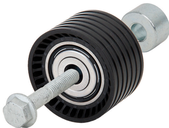
Obrázek 2: 532 0654 10 – vodicí kladky s novou koncepcí utěsnění a další namontované díly