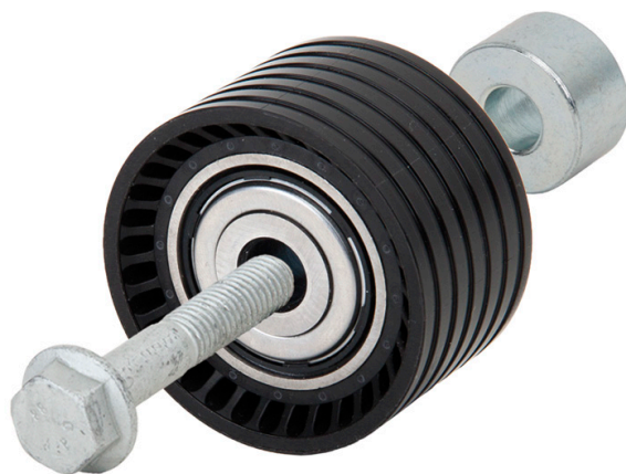
Снимка 2: 532 0654 10 – Отклоняваща ролка с нов дизайн на уплътнението и добавени компоненти

Арт. номера: 532 0774 10 (нов) 532 0654 10 (нов) 532 0221 10 (заменен)