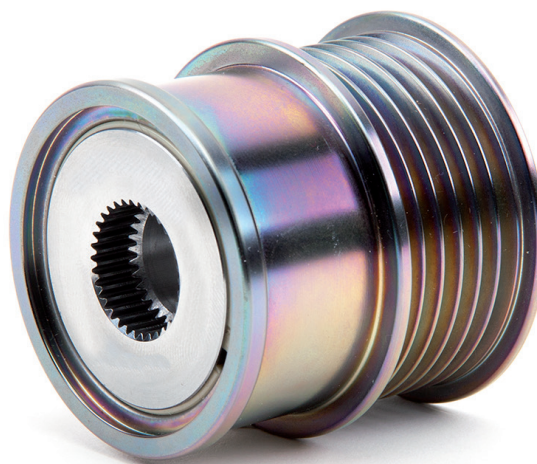
Figura 1: 535 0279 10 – ruota libera alternatore INA

Riferimento OE: 04E 903 201 04E 903 201 A 04E 903 201 E 8V0 903 119 8V0 903 119 A